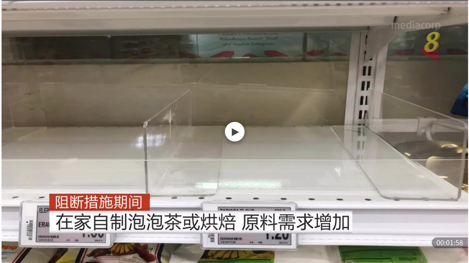
📷 【冠状病毒19】 泡泡茶和烘焙原料需求增加