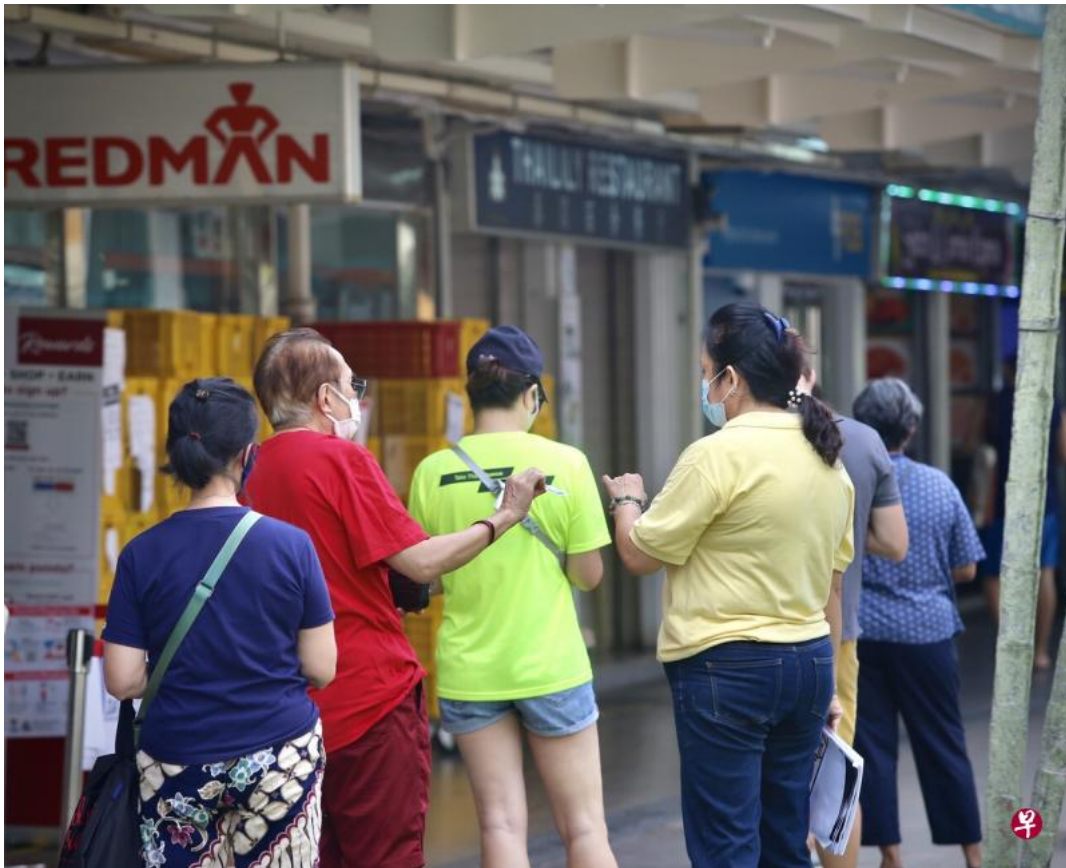
大巴窑奋发分店今早依旧大排长龙，店员要求顾客出示身份证入内，对未携带者暂时通融。